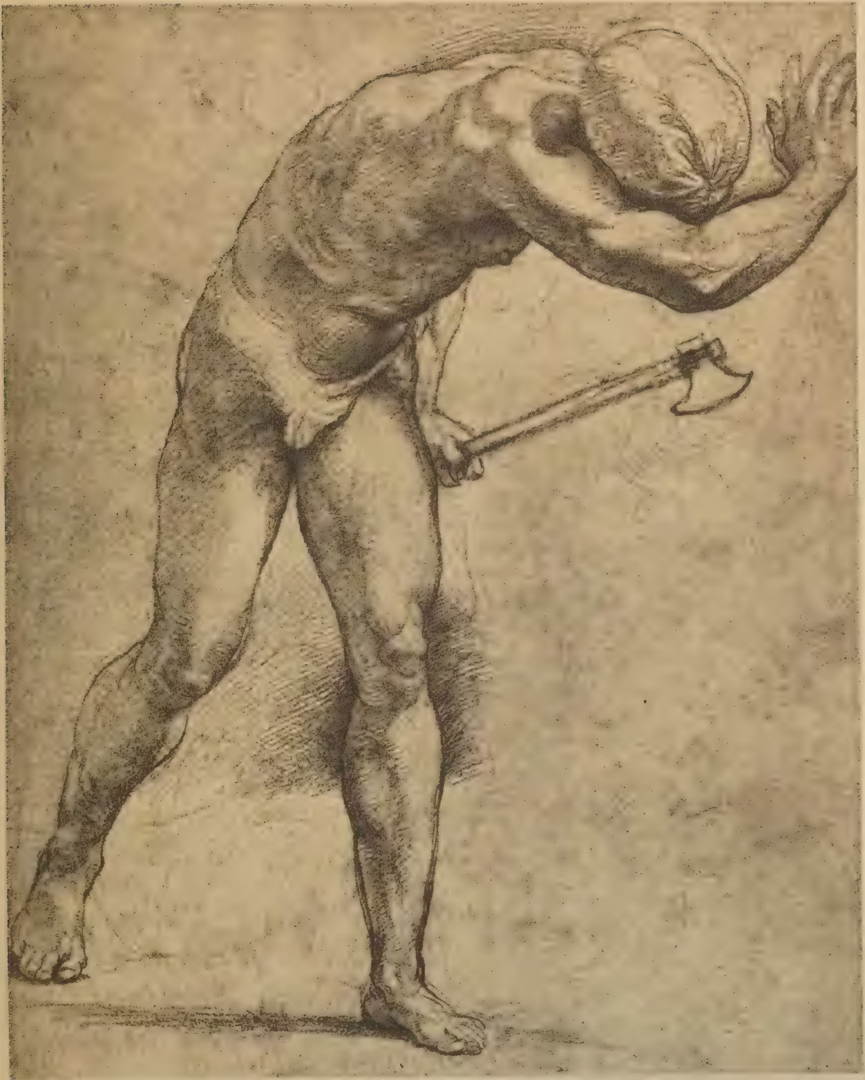
Etude pour un des soldats de la Libération de Saint Pierre